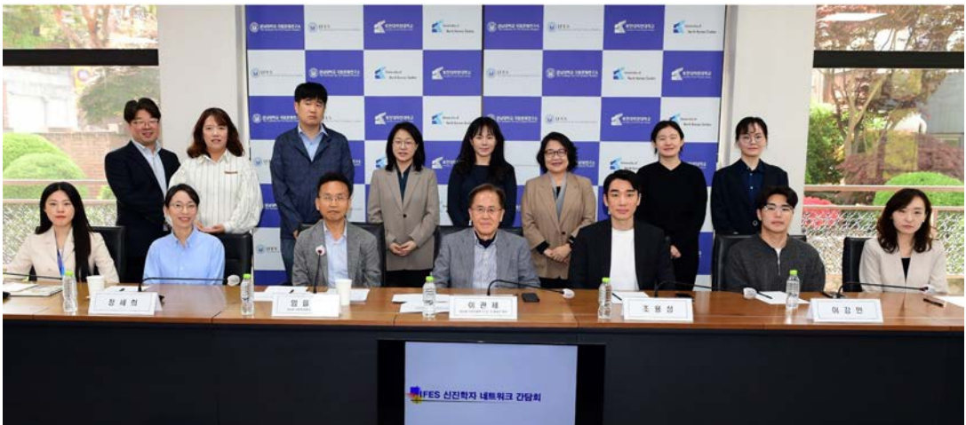
- 간담회 참석한 연구소 간부 및 신진학자들 -

극동문제연구소는 북한 통일 및 국제 분야의 학제 간 연구를 활성화하고 신진학자를 양성하기 위해 다양한 분야의 전문가들과 긴밀한 협력을 바탕으로 상호 발전할 수 있는 네트워크 구축을 추진하고 있다.