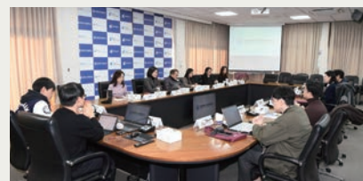
Roundtable of Next-Generation Korean Peninsula Researchers Network