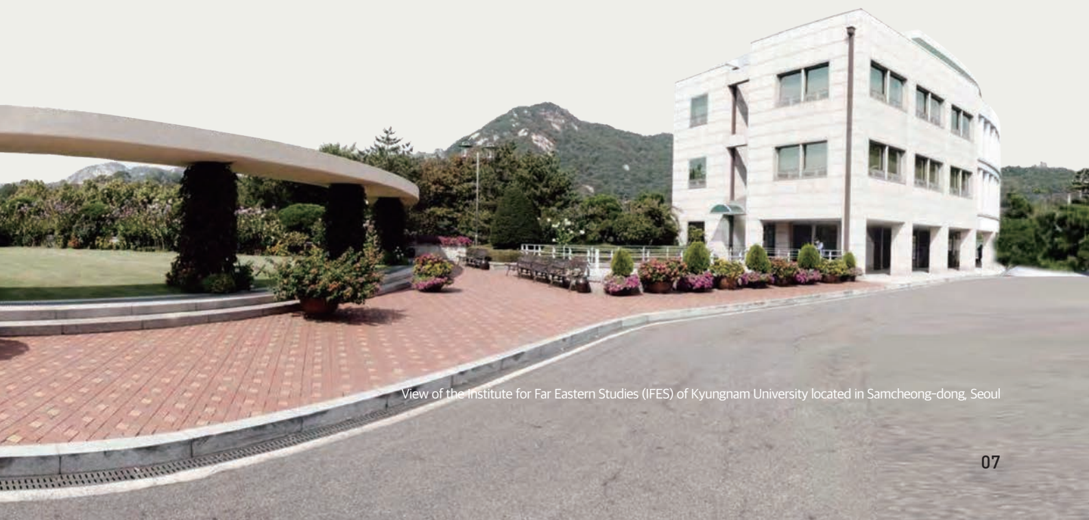
View of the Institute for Far Eastern Studies (IFES) of Kyungnam University located in Samcheong-dong, Seoul