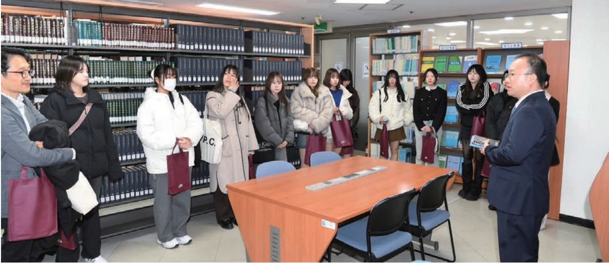
3월 6일 일본 도쿄하대 외국인 학생단 방문

경남대 극동문제연구소 도서관은 국내외의 북한·통일문제 연구자, 대학(원)생, 정관계 인사 등 방문자를 대상으로 설명회를 실시하였다.