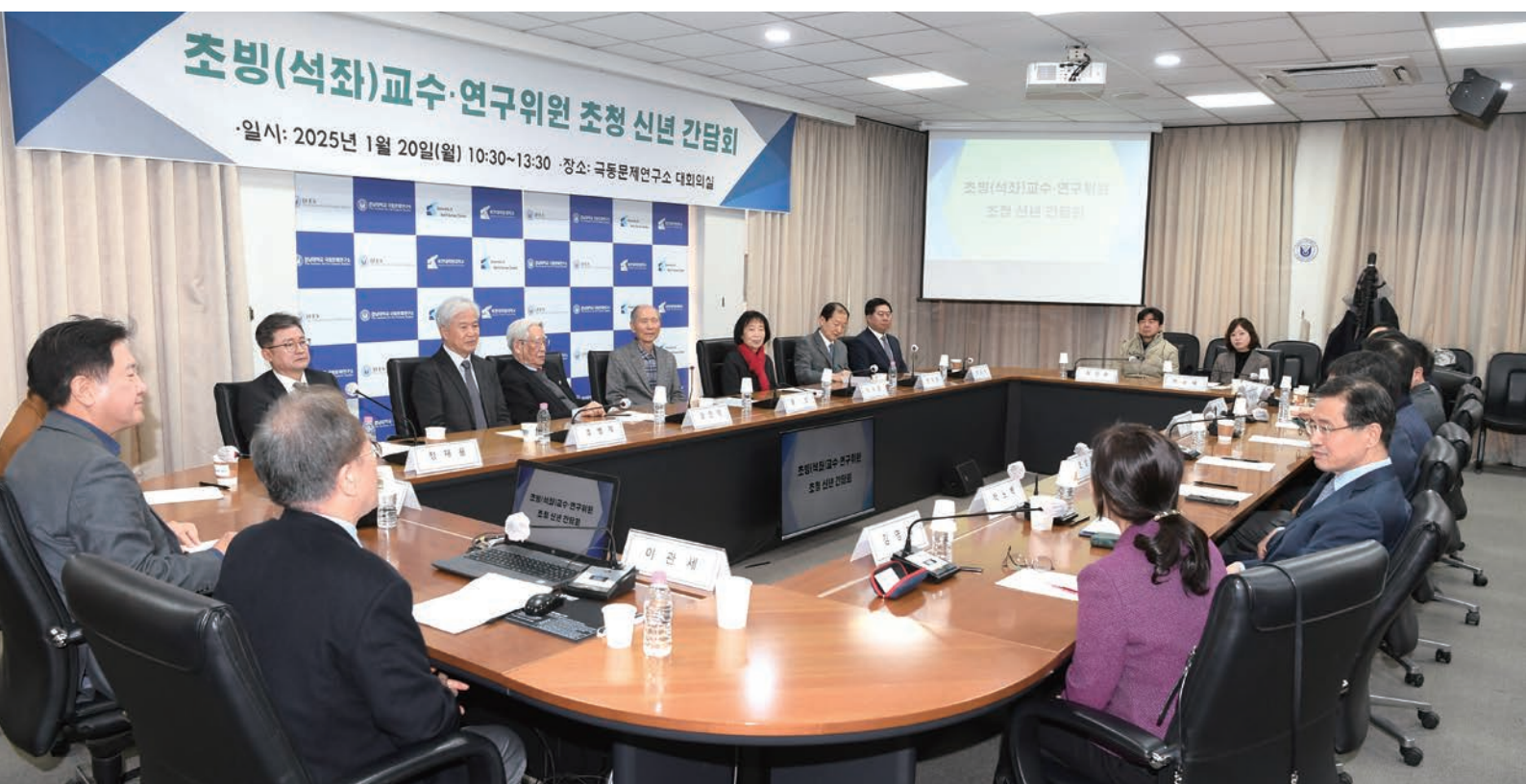
초빙(석좌)교수·연구위원 초청 신년 간담회