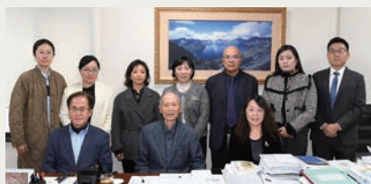
Roundtable Meeting during the Visit of the Research Delegation from the Jilin Academy of Social Sciences in China