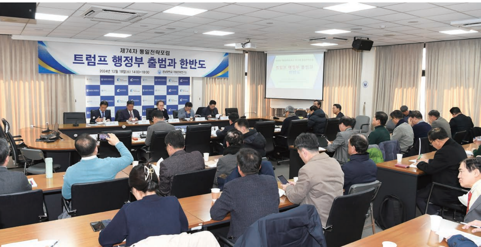
제74차 통일전략포럼 (2025년 1월 22일)