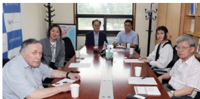
러시아 과학아카데미 중국 및 현대 아시아연구소 방문단 간담회