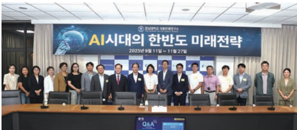
개강식 기념 촬영