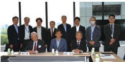
일본경제연구센터 연구진 간담회