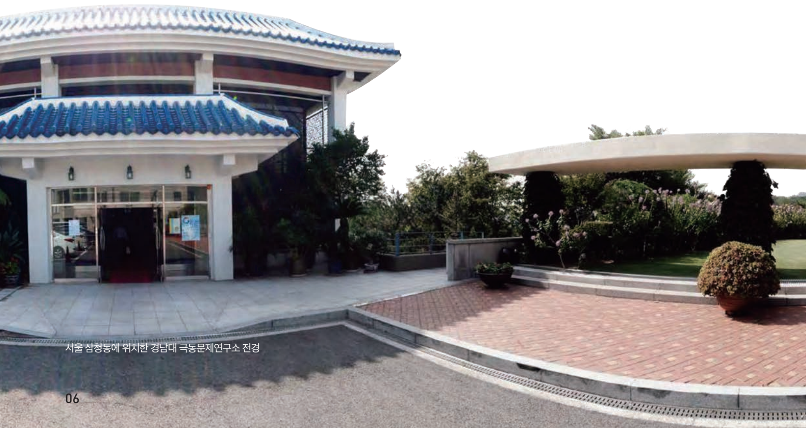
서울 삼청동에 위치한 경남대 극동문제연구소 전경