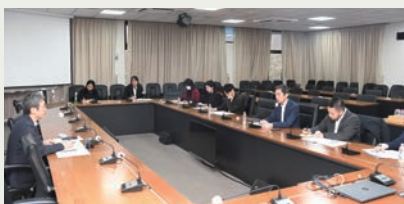
Roundtable during the Visit of Researchers from Keio University