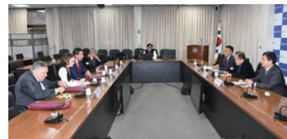
러시아과학아카데미 중국 현대 아시아 연구소 연구진 방문 간담회