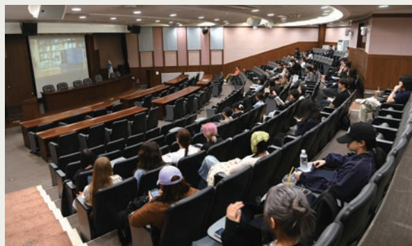
visit was "both educational and engaging for students with an interest in North Korea and East Asian international politics."